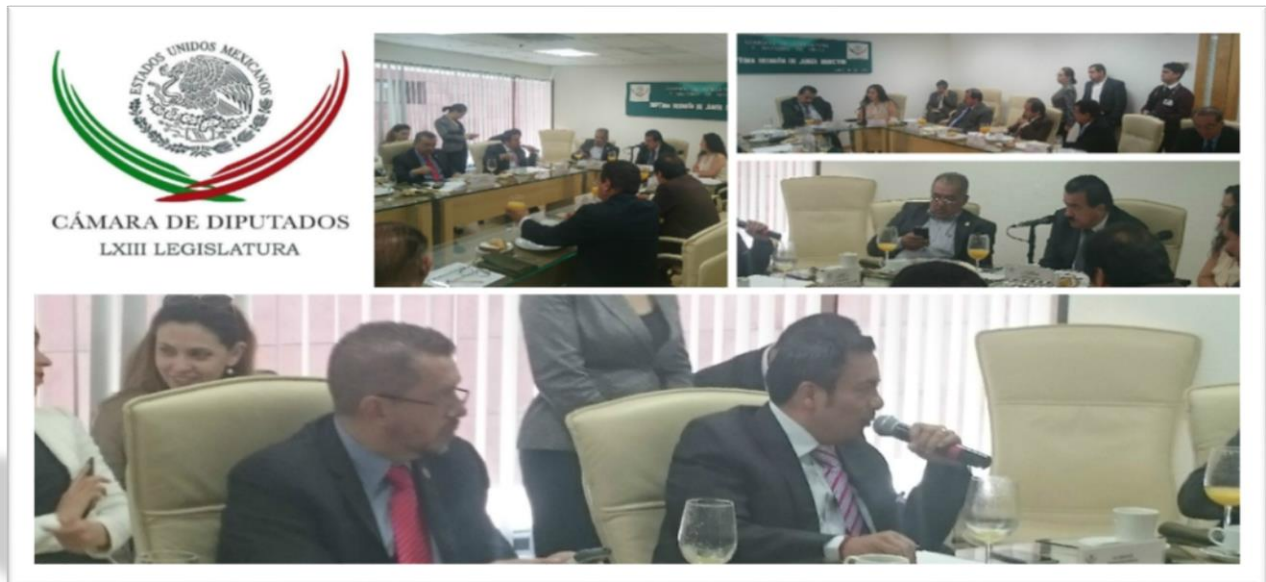
SEPTIMA REUNIÓN DE JUNTA DIRECTIVA