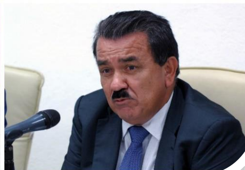
SUBCOMISION PEQUEÑOS PRODUCTORES