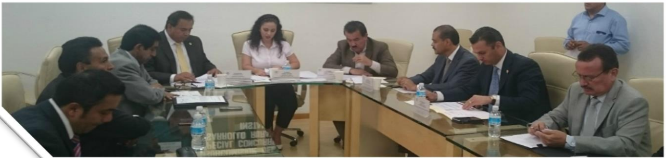
SUBCOMISION PROGRAMA ESPECIAL CONCURRENTE