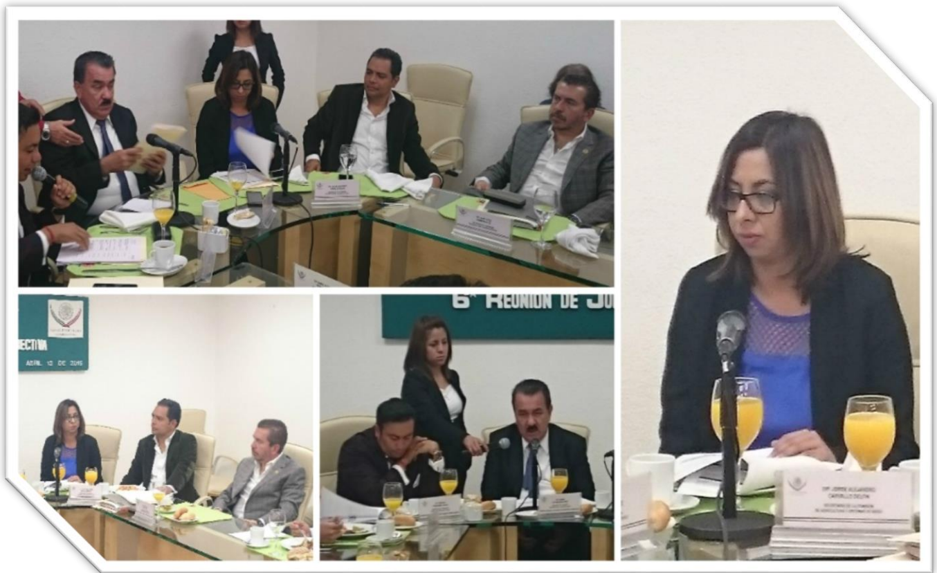
SEXTA REUNIÓN DE JUNTA DIRECTIVA