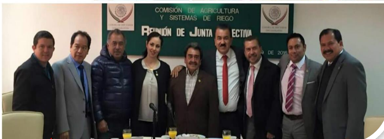
QUINTA REUNIÓN DE JUNTA DIRECTIVA